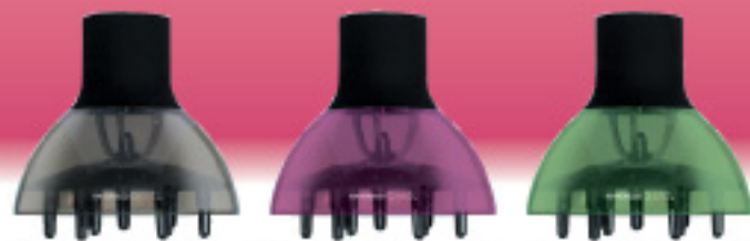
B-44 ディフューザー (グレー・パープル・グリーン)